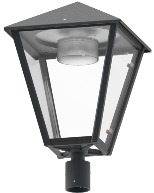
Mastüberwurf - Version